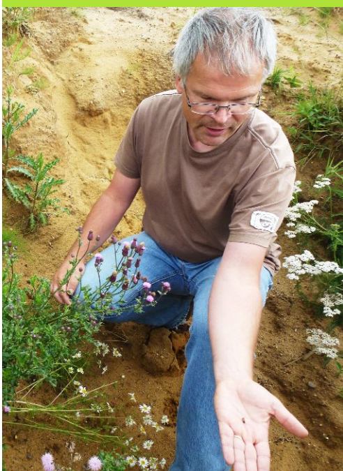
... schwups, eine Biene