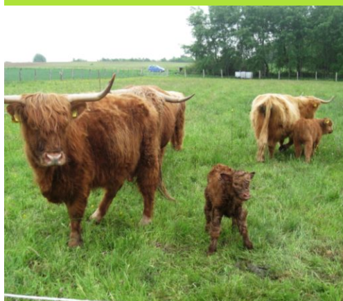
Die Schotten , ...