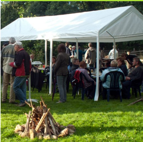
Das Lagerfeuer ist vorbereitet