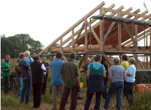
... und mit Richtkrone