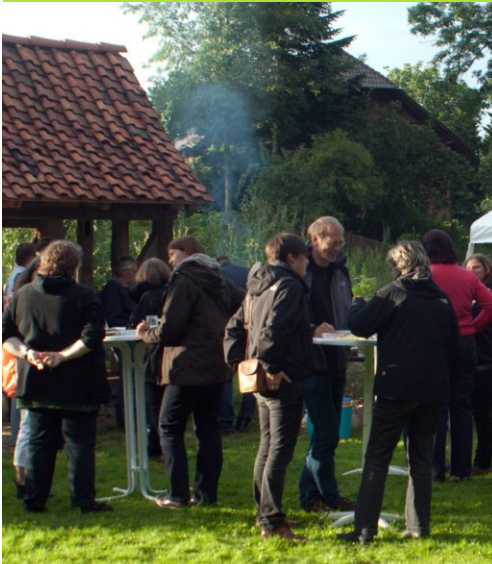
Plausch mit frisch Gezapftem