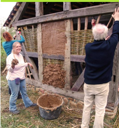
...und noch eine Hand voll Lehm ...