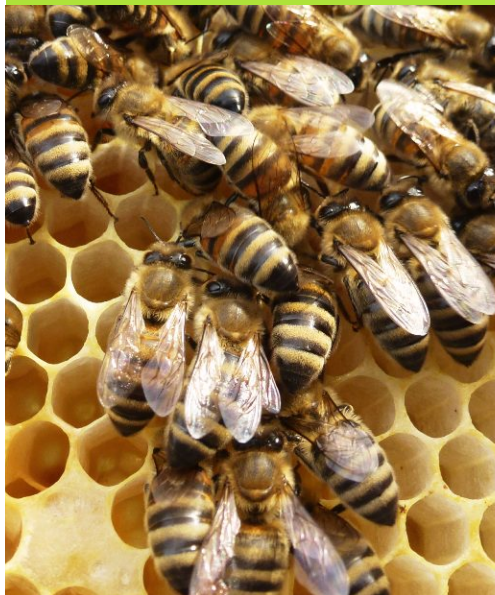
... und sammeln und sammeln ...