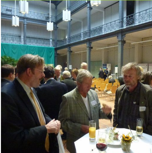
Plausch in festlichem Rahmen