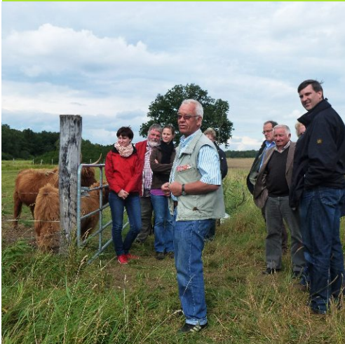
Interessierte Gäste bei den Rindern