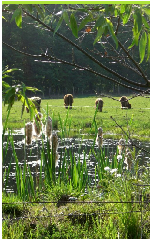
Weideidylle an der Woogewiese