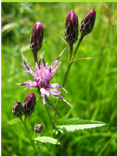
Färber-Scharte beim Aufblühen