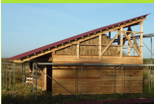
Das Bauwerk, schon mit Dach