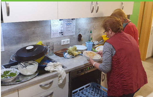
Fleißige Helferinnen beim Abwasch zwischendurch