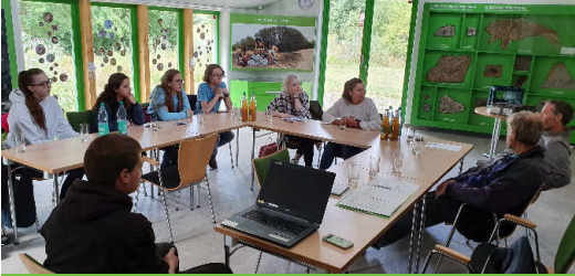
Einführung und Kennenlernen

Wie schon gesagt – einige Erfahrungen haben wir gemacht und wenn sich mal wieder eine solche Situation ergibt, werden wir uns sicher besser darauf vorbereiten. Klar ist, dass wir mit einer Gruppe dieser Größe, sowohl bei der Betreuung als auch finanziell an unsere Grenzen stoßen. Die Aufgaben beim FUN sind zu vielfältig, von Tag zu Tag zu unterschiedlich und daher auch nicht genau genug planbar. Mit einer kleinen Gruppe würden wir es sicher noch mal versuchen. Die Idee, Aspekte des Naturschutzes, wie wir ihn verstehen,