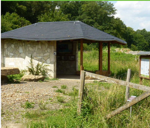
Geopunkt Hondelage - Mergelkuhle