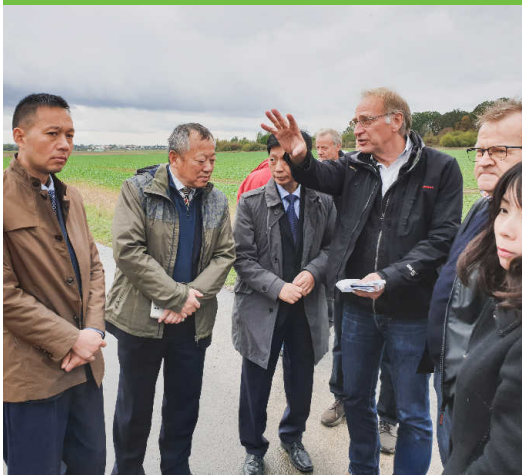
Erläuterungen in der Hondelager Feldmark

So oft kommt es nicht vor, dass wir im NEZ ausländische Besucher begrüßen können: Am 8. Oktober aber hatten wir Gelegenheit, das NaturErlebnisZentrum und den FUN einer chinesischen Delegation vorzustellen. Die Besucher aus der Provinz Anhui sowie zwei Dol- metscher und Vertreter der Landwirtschaftskammer haben sich an mehreren Tagen unterschiedliche Bereiche der ländlichen Entwick- lung in Niedersachsen angesehen. In Hondelage standen Flurberei- nigungsprojekte und die Umsetzung von Ausgleichsmaßnahmen im Vordergrund.