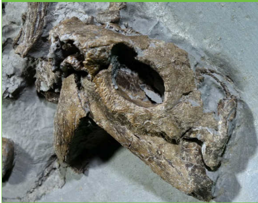
Schädel mit Augenhöhle und Unterkiefer