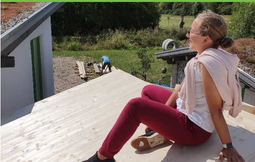
Das Dach ist fertig.