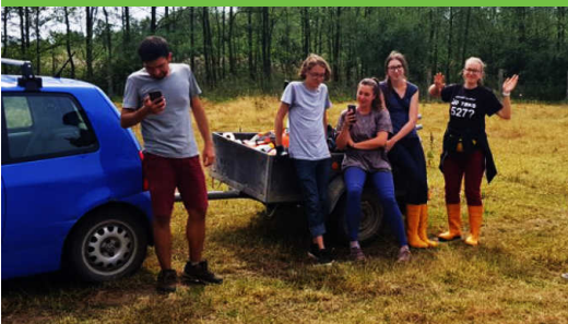
Kommunikation zwischendurch - ganz wichtig