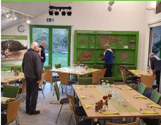
Tische und Dekoration ist vorbereitet ...