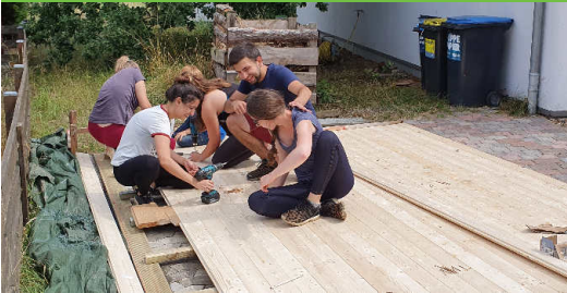
Das Gartenhaus entsteht