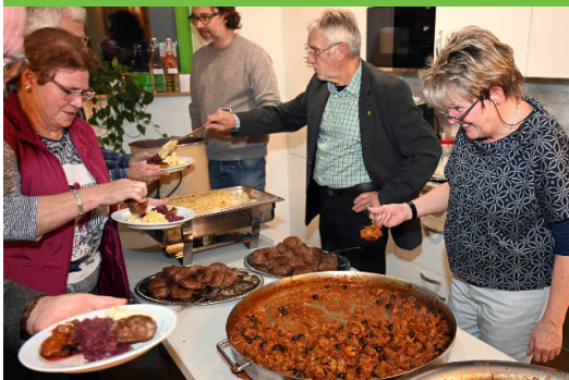
... die Gäste können bewirtet werden.