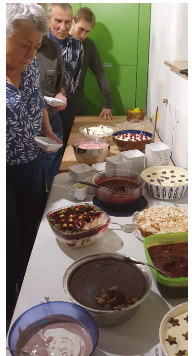
Das Dessert steht bereit

Resümee: Der Ortswechsel hat funktioniert, die Organisation hat geklappt – es war wie immer eine gelungene Veranstaltung.