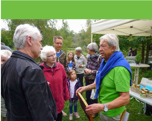
Ewald informiert über die Bienenhaltung