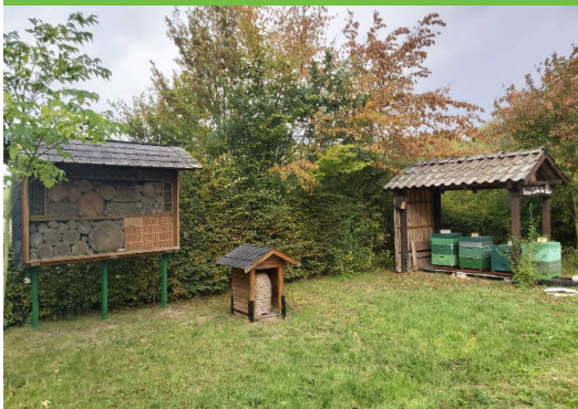
Bienenstöcke und Insektenhaus