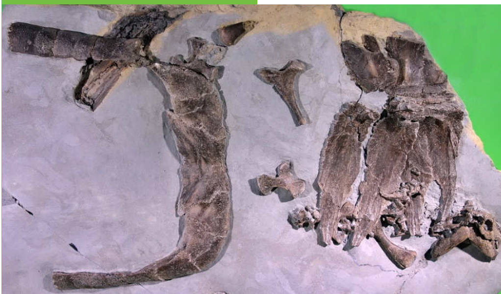
Schildkröte mit Panzer und Schädel