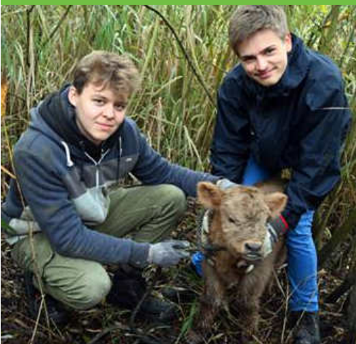
... und kuschelig.