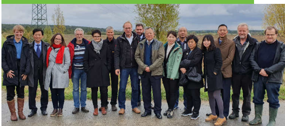
Gruppenbild mit Damen

Anschließend folgte der mehr praktische Teil des Tages: Eine kleine Exkursion in die Hondelager Feldmark. Unsere Besucher haben da- bei kennengelernt, wie die uns übertragenen Flächen in den Natur- schutz integriert wurden und welche Strukturveränderung die Landschaft dadurch bekommen hat. Die Vernetzung von Biotopflä- chen wurde erläutert und natürlich auch, wie wir uns in ehrenamtli- cher Arbeit für den Landschaftsschutz einsetzen. Ein Besuch des Geopunktes durfte nicht fehlen. An der ehemaligen Mergelgrube haben wir den interessierten Gästen erläutert, wie die Ausgra- bungen durchgeführt werden und was für Fundstücke schon ge- borgen wurden.