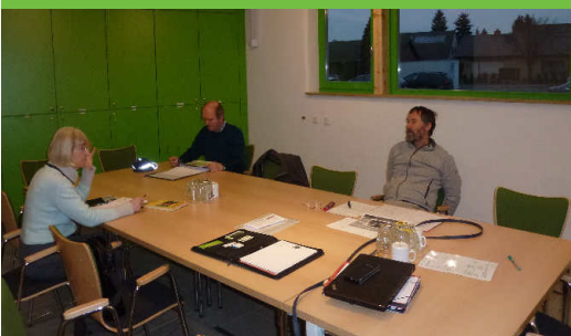
Ein Teil der Flyer-Runde in Diskussion