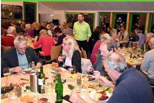
Volles Haus und gute Stimmung