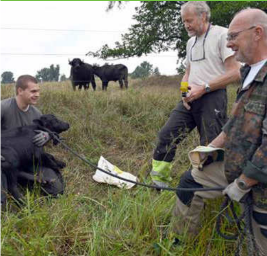
Immer wieder spannend ....