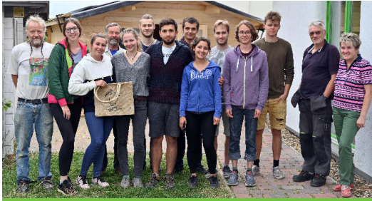
... die Zeit ist um.

jungen Leuten zu vermitteln und in die Welt zu tragen, ist sicher auf- gegangen. Alle nehmen Erfahrungen mit, die sie sonst nicht ge- macht hätten. Rinder umtreiben, auf dem Dach des Gartenhauses Bretter anschrauben, im Lehm Boden einen Brunnen buddeln, Zaun- pfähle setzen ... - alles Dinge, die weder in der Schule noch in der Uni auf dem Lehrplan stehen. Ich bin sicher, dass es eine bleibende Erin- nerung für unsere Studenten war – und hoffentlich eine gute.