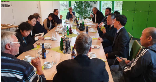
Begrüßung und Imbiss im NEZ