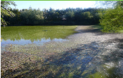
... ein wenig Wasser ist noch im Teich