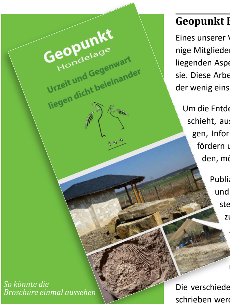
So könnte die Broschüre einmal aussehen